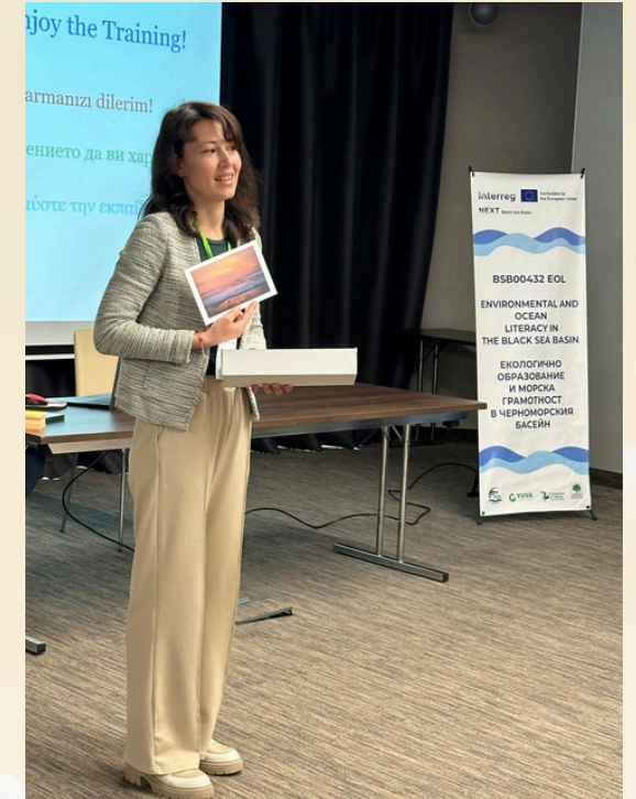
YUVA ekibi Burgaz'daki EOL İkinci Eğitimci Eğitimi Buluşması'nda. - YUVA team is at the EOL Second Trainer Training Meeting in Burgaz.