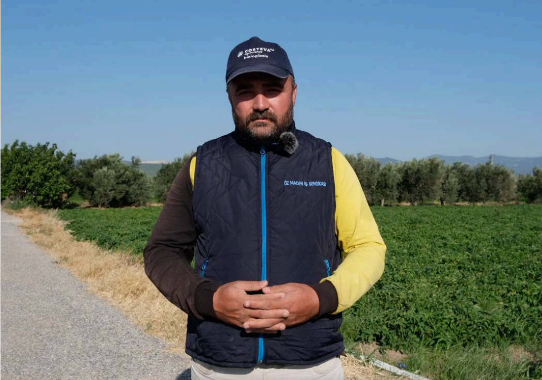
Adil geçiş hakkında yürütülen araştırmaya katılan bir Kinikli - A Kinikli participant in the survey on fair transition

You can follow all our activities and campaigns on our website and social media accounts.