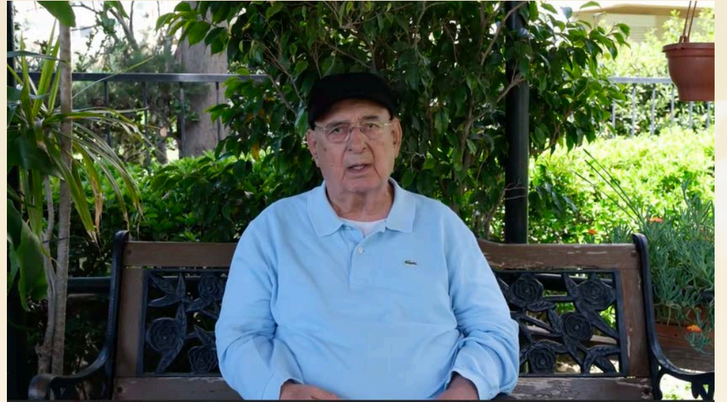
Türkiye’de çevre hareketinin ilk siyasi temsilcilerinden eski CHP milletvekili Kıvılcım Kemal Anadol röportajından. - From an interview with former CHP deputy Kıvılcım Kemal Anadol, one of the first political representatives of the environmental movement in Turkey.