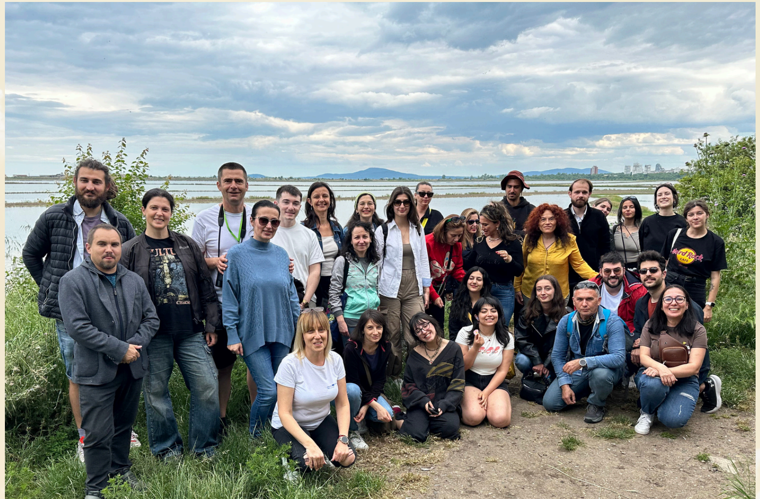
Burgaz'daki EOL İkinci Eğitimci Eğitimi Buluşması'ndan tüm partnerler ve katılımcılarla fotoğraf - Photo with all partners and participants from the EOL Second Trainer Training Meeting in Burgaz

The Environmental and Ocean Literacy in the Black Sea Basin Project will empower young adults (aged 18-35) through 30 dissemination trainings and an awareness