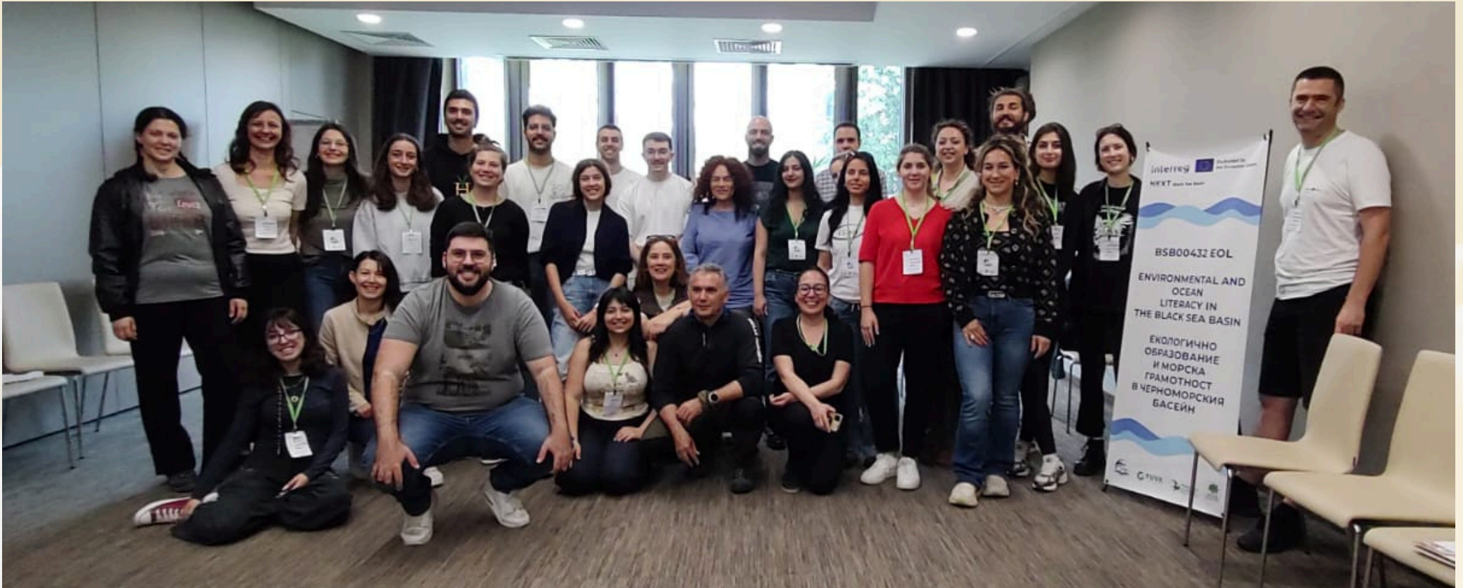
Burgaz'daki EOL İkinci Eğitimci Eğitim Buluşması'ndan tüm partnerler ve katılımcılarla fotoğraf - Photo with all partners and participants from the EOL Second Trainer Training Meeting in Burgaz

600 young adults in Turkey (Istanbul, Kırklareli, Edirne), Bulgaria (Burgas and Stara Zagora) and Greece (Thessaloniki, Kavala, Evros) will participate in environmental and ocean literacy dissemination trainings and 300 citizens will be reached with an awareness raising video on common environmental issues and ocean problems in the Black Sea and possible individual steps to be taken to solve them. At least 10,000 people from all three countries will be reached.