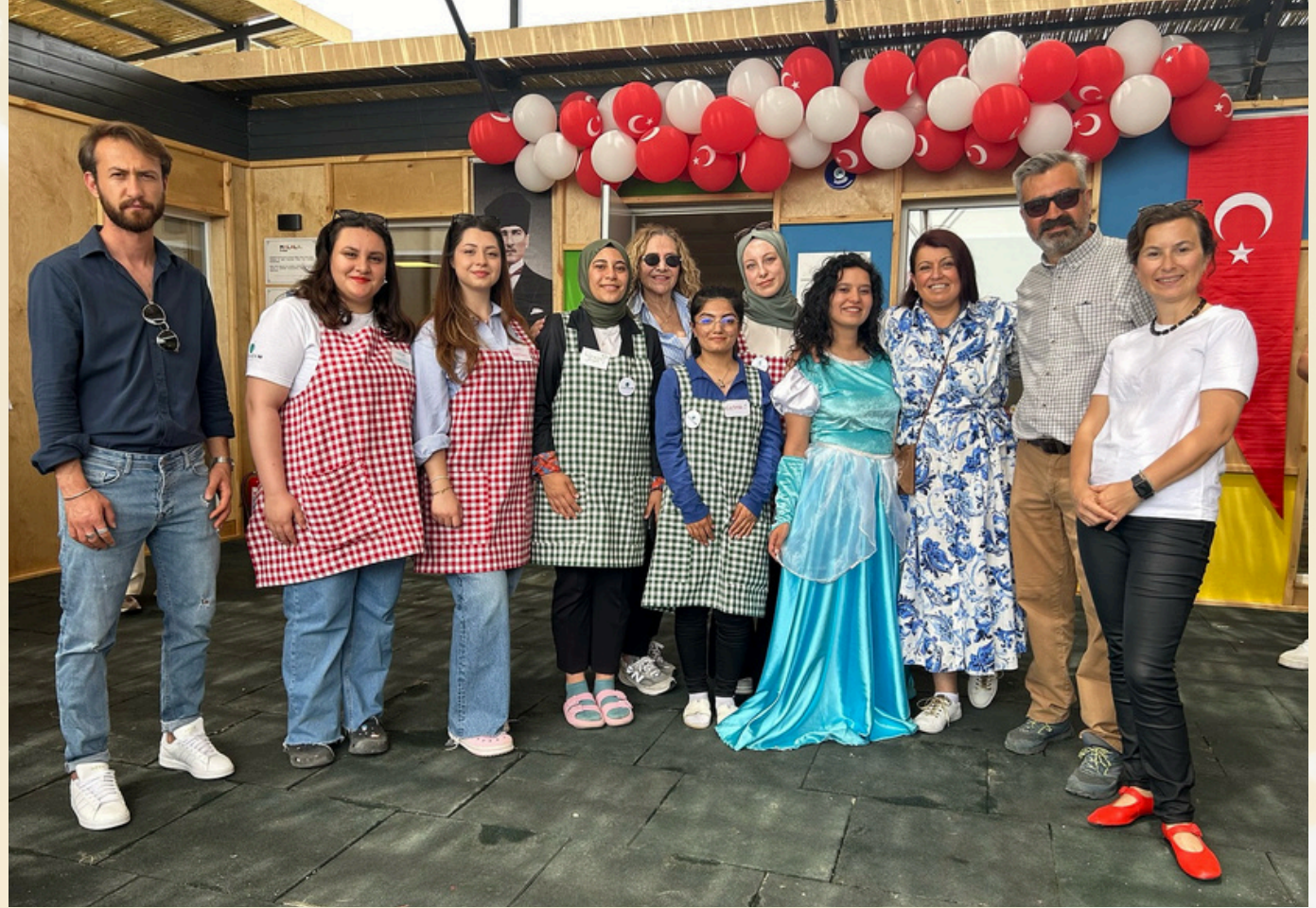
ÇABAÇAM Kahramanmaraş Umutkent Eğitim Destek Birimi'nin açılışı. - Opening of the ÇABAÇAM Kahramanmaraş Umutkent Education Support Unit.

Ayrıca, kadınlara ve bebeklere yönelik sosyal etkinlik alanları ve destek birimlerinin oluşturulmasına yönelik çalışmalar da sürdürülmektedir. Bu faaliyetlerin 2025 yılında da devam etmesi için tüm çabalarımızı kararlılıkla sürdüreceğiz. Proje, Malala Fund, Foundation De France ve Sivil Toplum için Destek Vakfı tarafından sağlanan kaynaklarla hayata geçirilmiştir.