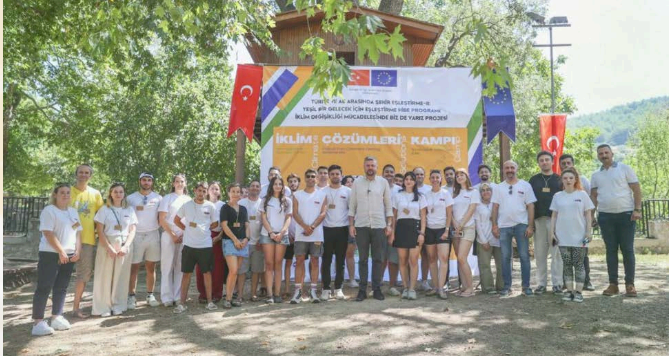
İklim Çözümleri Kampı, 12-18 Ağustos 2024, Buca/İzmir - Climate Solutions Camp, August 12-18, 2024, Buca/Izmir

Proje, paydaş belediyelerin iklim değişikliğinin olumsuz etkilerini azaltmaya ve uyuma yönelik kapasite geliştirme çalışmaları ile savunmasız yerel halkın, özellikle iklim değişikliğinden en fazla etkilenen çocuk, genç ve kadınların farkındalığını artıracak faaliyetler gerçekleştirmeyi amaçlamaktadır. Proje yılın son ayında düzenlenen kapanış toplantısı ile sona ermiştir.