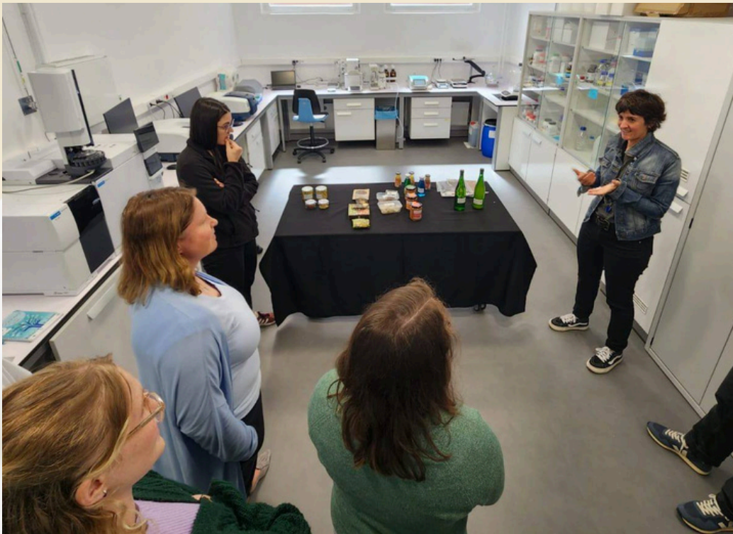
15-16 Mayıs 2024 San Sebastian'da SMALEI buluşması - SMALEI meeting in San Sebastian on May 15-16, 2024

In the last months of the year, with the technical support of YUVA, a series of webinars were organized under the name of SMALEI Digital Academy. These online activities have been an important resource for disseminating the sustainability perspective in the field of adult education and equipping educators.