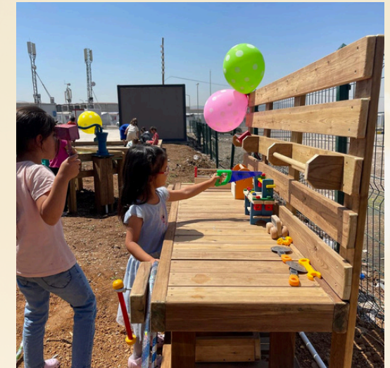
ÇABAÇAM Kahramanmaraş Umutkent Eğitim Destek Birimi'nin açılışı. - Opening of the ÇABAÇAM Kahramanmaraş Umutkent Education Support Unit.