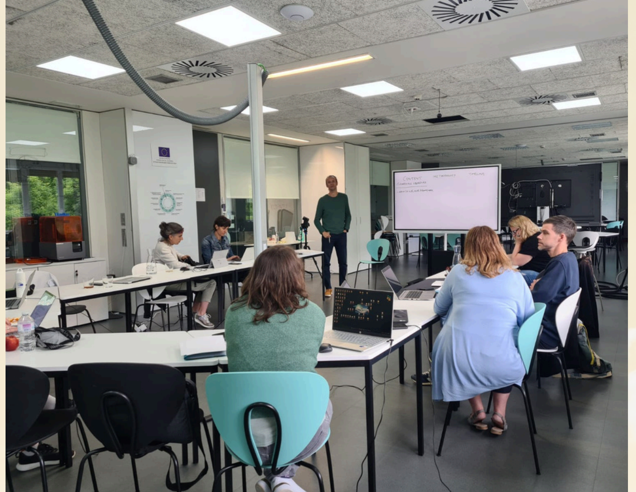
15-16 Mayıs 2024 San Sebastian'da SMALEI buluşması - SMALEI meeting in San Sebastian on May 15-16, 2024

Bu çevrimiçi etkinlikler, yetişkin eğitimi alanında sürdürülebilirlik perspektifinin yaygınlaştırılması ve eğitimcilerin donanımlarını artırmaları için önemli bir kaynak oluşturdu.