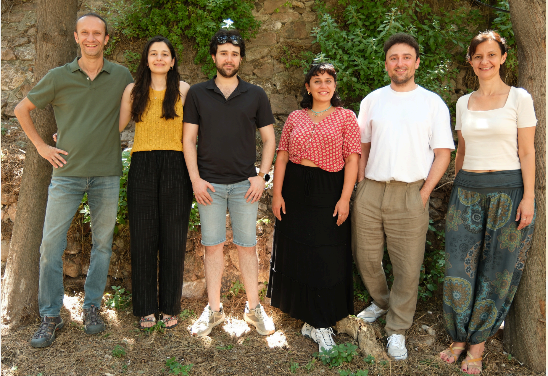
YUVA Ekip Buluşması, Ayrılık - YUVA Team Meeting, Ayrılık