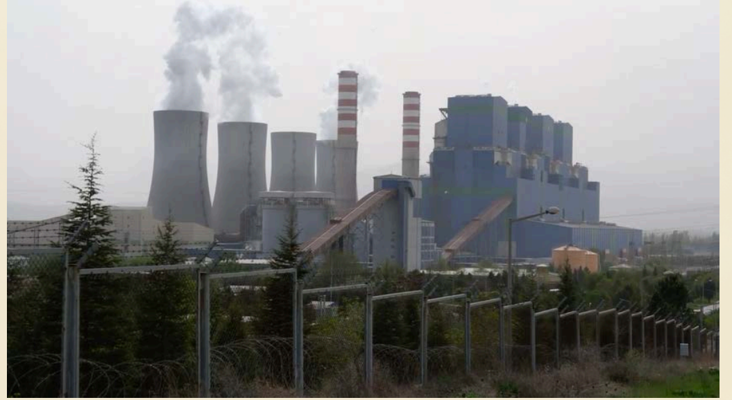
Afşin-Elbistan Termik Santrali video-belgeselinden genel çekim. - General shot from Afşin-Elbistan Thermal Power Plant video-documentary.

Yürüttüğümüz tüm çalışmaları ve kampanyalarımızı web sitemizden ve sosyal medya hesaplarımızdan takip edebilirsiniz.