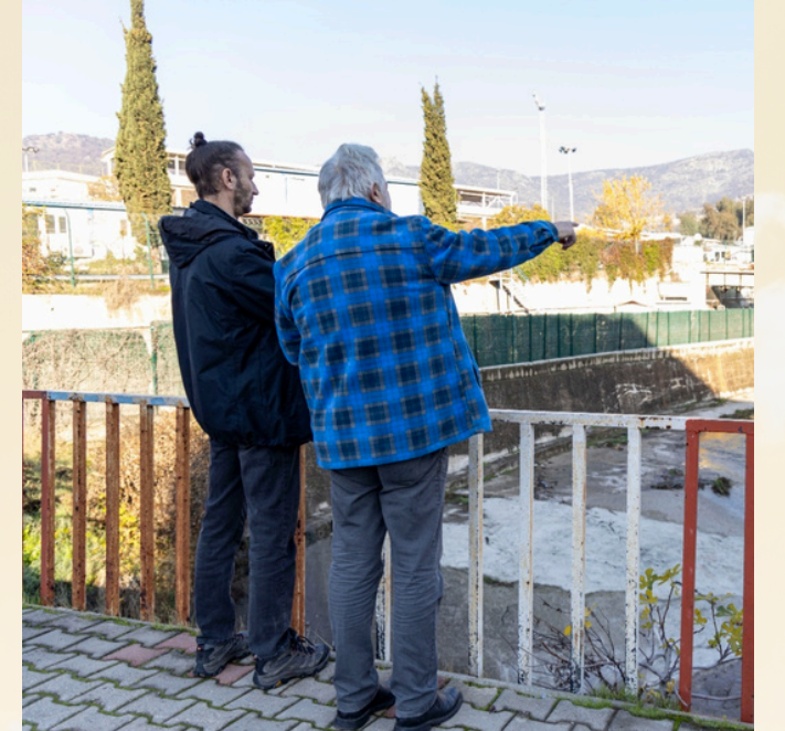
Panel ve sonrasındaki saha gezisinden fotoğraflar - Photos from the panel and subsequent field trip