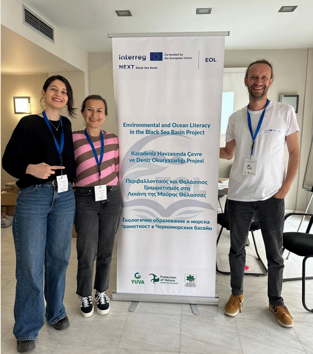
YUVA ekibi Selanik'teki EOL Birinci Eğitimci Eğitimi Buluşması'nda, - YUVA team at the EOL First Trainer of Training Meeting in Thessaloniki.